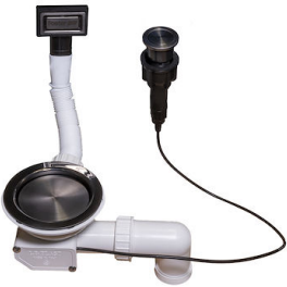
VIDAGE FADE PUSH GUN METAL A407 A20