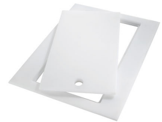
PLANCHE DE DECOUPE DOUBLE HDPE