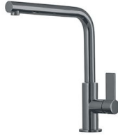
VERONA GUN METAL R497 S56