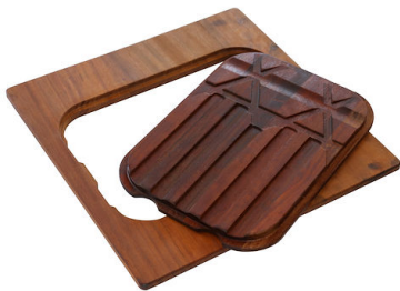
PLANCHE DE DECOUPE DOUBLE IROKO